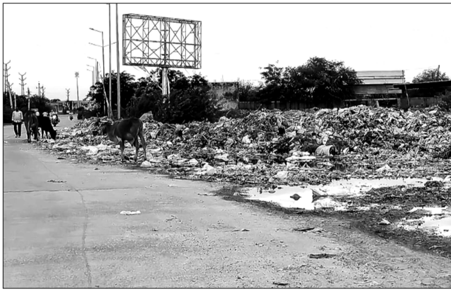
मालपुरा शहर के अजमेर रोड पर मुख्य सड़क किनारे करोड़ों रूपयों की बेसकीमती जमीन पर कचरा डाला जा रहा है।

शहर के 35 वार्डों से प्रतिदिन दर्जनों ऑटोकीपर व ट्रैक्टरों के माध्यम से कचरा संग्रह कर टोडारोड के पास कल्याणपुरा रोड पर पालिका की तकर्रीबन 20 बीघा जमीन पर आर्क्षित डम्पिंग यार्ड में कचरा डालने का प्रावधान है, लेकिन सफाई ठेकेदार निश्चित स्थान पर कचरे को डालने के बजाय भूमिफियाओं से मिलकर मुख्य सड़क किनारे कचरे के ढेर लगा गड़ुँ में तब्दील जमीन का समतलीकरण करने में अपनी महत्वपूर्ण भूमिका निभा रहा है। सूत्रों की माने तो ऑटोकीपर व ट्रैक्टरों में डीजल की खपत उत्तनी ही दर्शाई जा रही है जितनी कल्याणपुरा रोड पर डम्पिंग