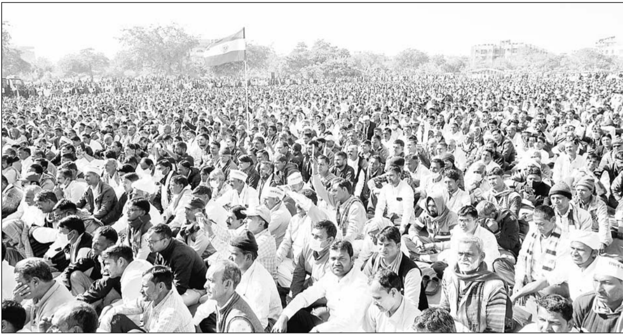
प्रदेशभर से जयपुर पहुंचे राशन डीलरों ने विद्याधर नगर स्टेडियम में महासम्मेलन के जरिये शक्ति-प्रदर्शन किया।