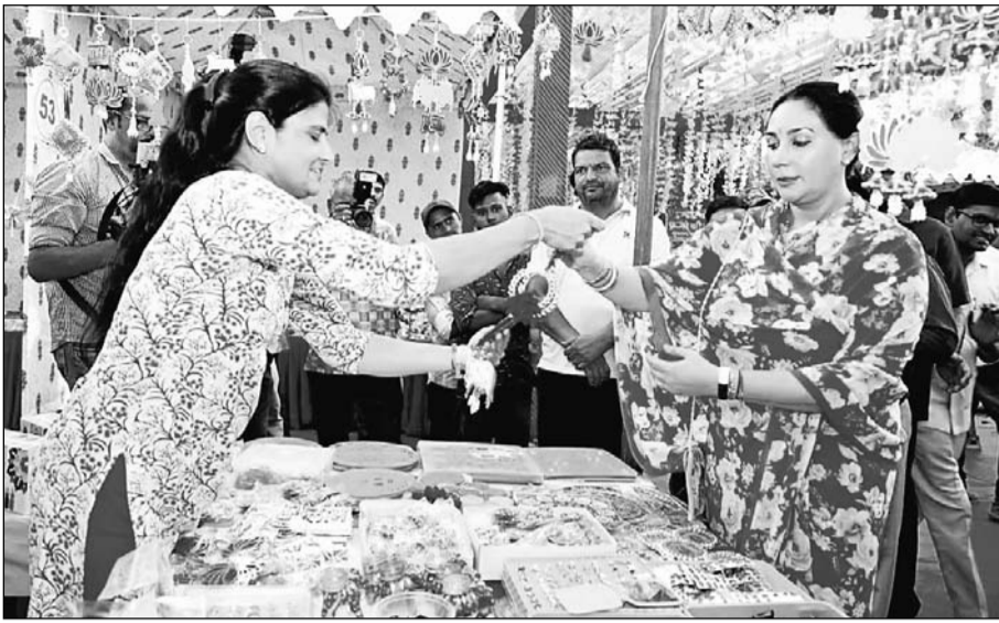
उपमुख्यमंत्री दिया कुमारी ने जवाहर कला केंद्र में आयोजित राज्य स्तरीय अमृता हाट में खरीदारी की।

उन्होंने इस अवसर पर मीडिया से बात करते हुए कहा कि राज्य सरकार महिला हस्तकारों को मौक़ा, मंच और मार्केट देने के लिए प्रयासरत है। दिया कुमारी ने कहा कि स्वयं सहायता सामूह की महिलाओं द्वारा निर्मित हस्त निर्मित