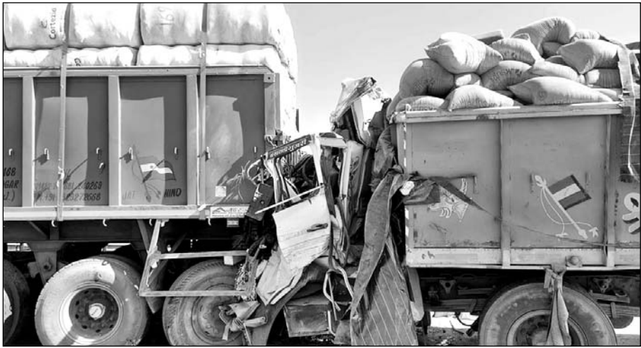
अजमेर-भीलवाड़ा हाईवे पर स्थित कोठारी नदी की पुलिया पर घने कोहरे से कई वाहन टकरा गए, इनमें एक यात्री बस भी शामिल है।

अजमेर-भीलवाड़ा हाईवे पर स्थित कोठारी नदी की पुलिया पर हादसा हुआ