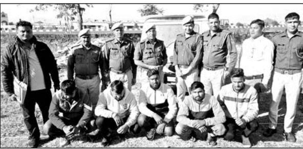
पुलिस ने हमला करने के आरोपियों को गिरफ्तार किया।