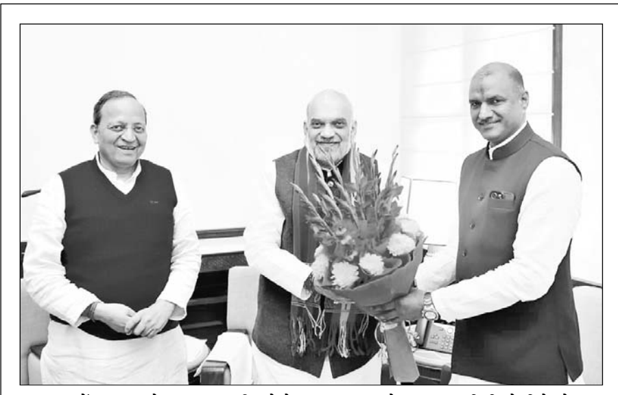
राजस्थान में भाजपा को स्पष्ट बहुमत मिलने के बाद भाजपा प्रदेश अध्यक्ष सी.पी. जोशी ने सोमवार को भाजपा राष्ट्रीय अध्यक्ष जे.पी. नड्डा व केंद्रीय गृहमंत्री अमित शाह से मुलाकात की।

जयपुर, (का.सं.)। राजस्थान में 199 विधानसभा सीटों पर हुए चुनाव के नतीजे सामने आ चुके हैं लेकिन इसमें सबसे ज्यादा हैरानी की बात यह है कि तीन लाख 82 हजार 45 वोटर्स ने 'नोटा' का विकल्प चुना है। यह वोट प्रदेश की 13 विधानसभा क्षेत्रों में पड़े हैं। ऐसे में सवाल यह उठता है कि कांग्रेस व भाजपा के साथ-साथ अन्य राजनैतिक दलों और निदर्शीय प्रत्याशियों में क्या एक भी योग्य उम्मीदवार इन लोगों की नजर में नहीं था। जानकारी के मुताबिक नसीराबाद, कटूमर, बांसवाड़ा, बायत, चोहटन, आसीन्द, जहाजपुर, कोटपुतली, हवामहल, भीनमाल, जायल, खींवर और मावली विधानसभा क्षेत्र के लोगों ने नोटा का विकल्प चुना।