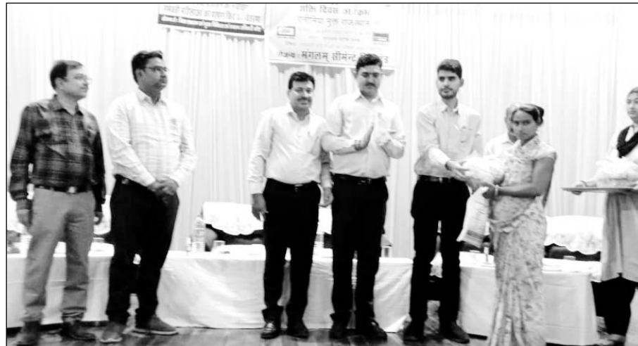
प्रधानमंत्री सुरक्षित मातृत्व दिवस पर गर्भवती महिलाओं को पोषाहार किट वितरित किये।

पिछले कुछ दिनों से रुपए मांगने वाले काफी दबाव बना रहे थे परंतु कहीं से पेमेंट नहीं आने के कारण वह मांगने वालों को पैसे नहीं लौटा पा रहा था कर्ज मांगने वालों को पैसा चुकाने के लिए उसने लूट की झूठी घटना स्वीकार किया है।