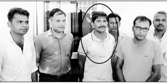
बूंदी एसबी की टीम ने आरोपी को गिरफ्तार किया।