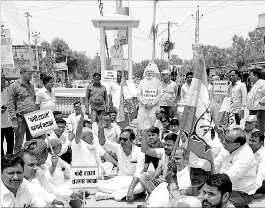
मालपुरा में अग्निपथ योजना के विरोध में नहीं जुटे कांग्रेसी।

विरोध प्रदर्शन को लेकर वरिष्ठ कांग्रेसियों सहित कांग्रेस संगठन के विभिन्न पदों पर काबिज पदाधिकारियों व कांग्रेस पार्टी के बैनर से जीते जनप्रतिनिधियों ने भी विरोध प्रदर्शन से दूरियां बना ली। लम्बे समय से कांग्रेस में चली आ