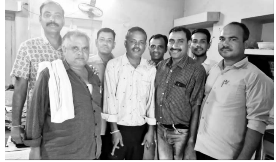
भीलवाड़ा एसीबी की टीम ने आरोपियों को गिरफ्तार किया।

साढ़े तीन साल पूर्व दिए बिलों के शेष भुगतान के लिए ली रिश्वत