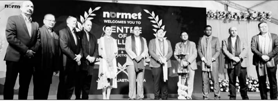
नॉर्मेट समूह ने राजधानी जयपुर में सेंटर ऑफ एक्सिलेंस का उद्घाटन किया।