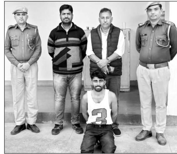
सीआईडी क्राइम ब्रांच रेंज सेल जोधपुर की टीम ने आरोपी होटल संचालक को गिरफ्तार किया।

जोधपुर, (निर्स)। सीआईडी क्राइम ब्रांच रेंज सेल जोधपुर की टीम ने विदेशी कोयले की चोरी का खुलासा किया है। सिणधरी थाना क्षेत्र में मेगा हाईवे स्थित एक होटल के पीछे बने बाड़े में गुप्त रूप से यह कारोबार चल रहा था। मामले