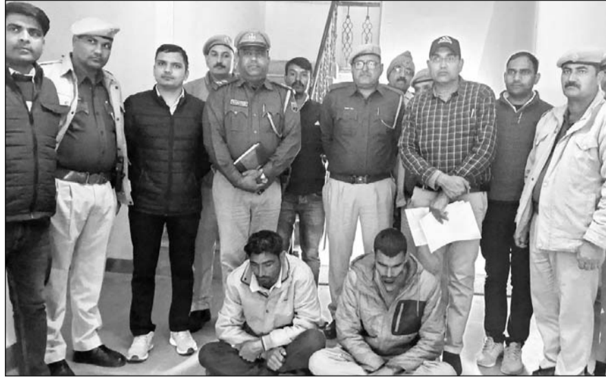
साइबर फील्ड अभियान के तहत साइबर सेल और गच्छीपुरा थाना पुलिस ने कार्रवाई की।