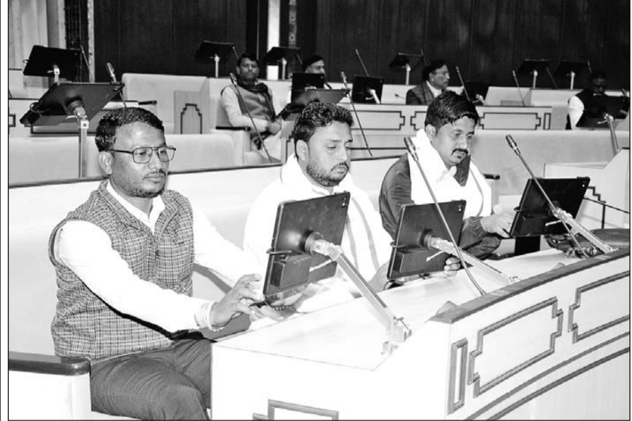
विधानसभा के सदन में आयोजित समारोह में लगभग एक सौ दस विधायकों ने बुधवार को आइपेड के माध्यम से एक दिवसीय प्रशिक्षण लिया।

■ 'तकनीकी युग की आवश्यकता अनुसार राजस्थान विधानसभा को बनाया जा रहा है पेपरलेस'