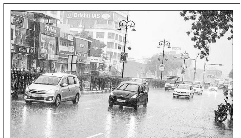
जयपुर में दोपहर बाद काली घटाएं घिर आईं और तेज बर्फा होने लगी। इस दौरान सड़कों पर पानी भर गया और वाहन चालकों को भारी परेशानी का सामना करना पड़ा। वहीं भारी ठंड की वजह से लोग घरों में दुबकने को मजबूर हो गये।

कोंग्रेस सेवा दल भी अपने पुराने स्वरूप को निखारकर संगठन को और मजबूत बनाते हुए आरएसएस को टक्कर देने की तैयारी में है।