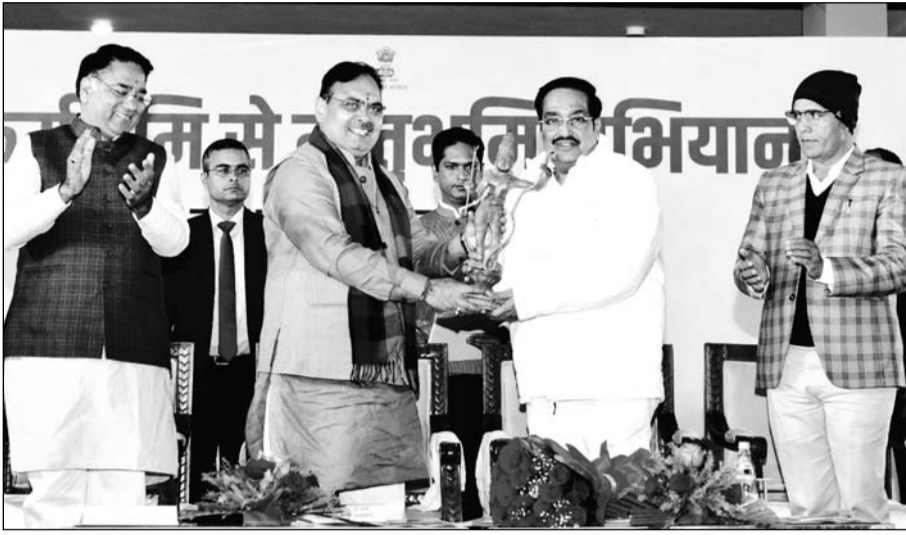
कर्मभूमि से मातृभूमि अभियान के अंतर्गत सांगानेर में मुख्यमंत्री भजनलाल शर्मा ने केन्द्रीय जलशक्ति मंत्री सी.आर. पाटिल का स्वागत किया।

पाटिल ने कहा कि राजस्थान के लोगों से अधिक पानी के महत्व को कोई