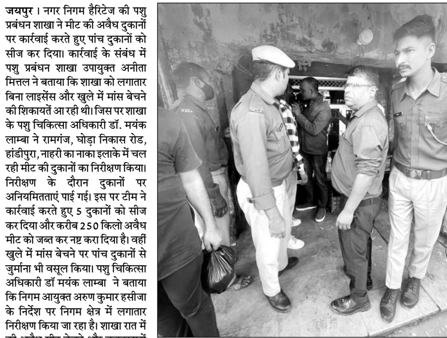
नगर निगम हैरिटेज की पशु प्रबंधन शाखा ने बुधवार को परकोटा क्षेत्र में संचालित मांस की अवैध दुकानों पर कार्रवाई की।

वहीं राजस्थान लोक सेवा आयोग अजमेर के वरिष्ठ अध्यापक (माध्यमिक शिक्षा) द्वितीय श्रेणी प्रतियोगी परीक्षा वर्ष 2022 के सामान्य ज्ञान एवं शैक्षिक मनोविज्ञान विषय की परीक्षा