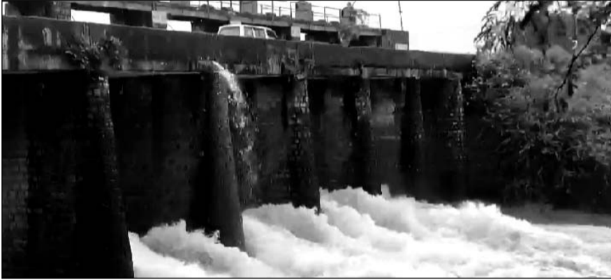
भरतपुर जिले के सबसे बड़े बांध बंध बारैठा के पांच गेट खोलकर पानी की निकासी की।

भरतपुर रियासत की ओर से करीब 132 वर्ष पूर्व 1892 में बनाया गया यह बांध बयाना के डांग क्षेत्र के बीहड़ों के बीच स्थित है। इस बांध के एक बार फिर से उफान मारने पर गुरुवार को इस बांध के चार गेटों को 9-9 फीट खोलकर और एक गेट को 4 फीट खोलकर बांध में से ओवरफ्लो पानी की निकासी की जा रही है। यह पानी बांध से जुड़ी कुकंद नदी में छोड़ा