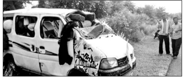
हादसे में इको कार क्षतिग्रस्त हो गई।

तारानगर, (निसं)। तारानगर क्षेत्र के गांव जिगसाना ताल में ईट-भट्टा के पास ईको कार टायर फटने से पलट गई। हादसे में तीन जनों की मौत हो गई व पांच जने