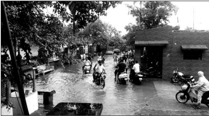
भरतपुर में भारी बरसात से कई जगह पर जल भराव हो गया।

भरतपुर, (निसं)। कई वर्षों के बाद भरतपुर के लोगों पर मानसून जमकर मेहरबान हुआ है, लेकिन पिछले दो दिन से लगातार हो रही बारिश ने लोगों को परेशान करके रख दिया है। अब लोग भगवान से प्रार्थना करने लगे हैं कि जल्द से जल्द बारिश का दौर खत्म हो और उन्हें राहत मिले। शहर की ऐतिहासिक सुजानगंगा नहर अपनी सीमाओं से बाहर आकर मंसा मंदिर व गांधी पार्क तक पहुंची।