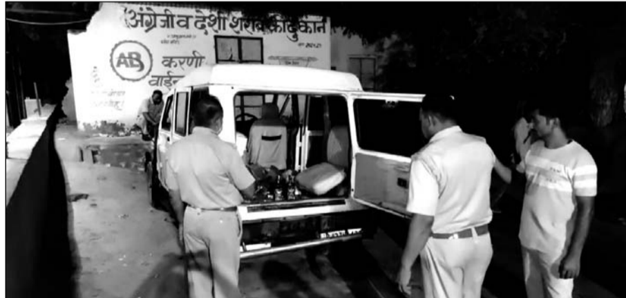
आबकारी पुलिस को बोलेरो की जांच में अवैध शराब मिली।