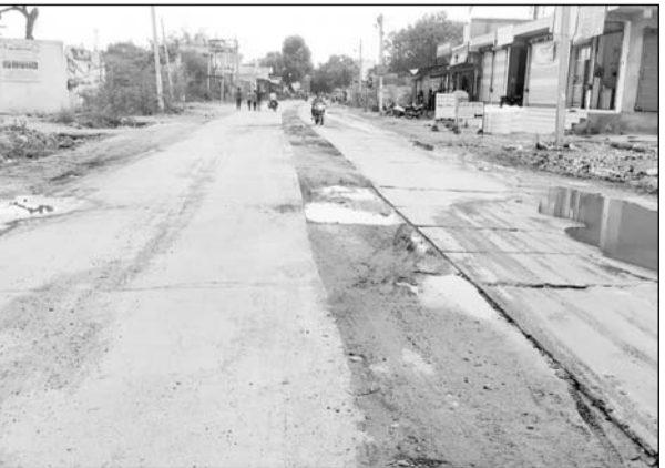
डिवाइडर के लिए छोड़ी गई जगह ने गड्डों का रूप ले लिया है।

■ पीडब्ल्यूडी अपना पलड़ा ग्राम पंचायत पर थोप रहा है