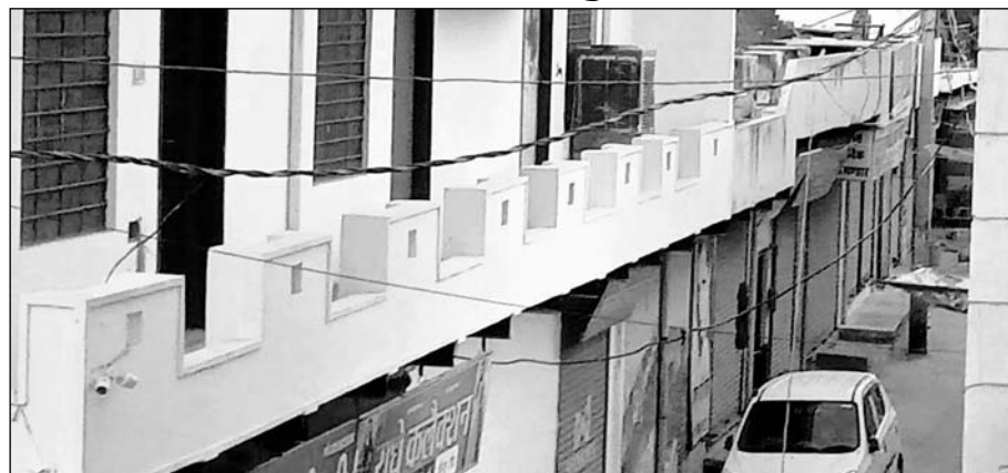
महिला पार्षद का मकान जहां लाइन से डायरेक्ट कनेक्शन ले रखा है।