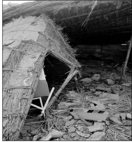
तेज अंधड़ से गिरा छप्पर व फैला मलबा।