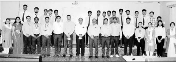
गिट्स में 11 विद्यार्थियों का फील्ड इंजीनियर के पद पर चयन हुआ।

उदयपुर, (कासं)। गीतांजली इंस्टिट्यूट ऑफ टेक्निकल स्टडीज, डबोक, उदयपुर में ऑनलाइन केम्पस इंटरव्यू द्वारा विश्व की प्रमुख कम्पनी थर्मैक्स लिमिटेड में मेकेनिकल इंजिनियरिंग विभाग के 9, इलेक्ट्रोनिक्स एवं कम्प्यूटिकेशन विभाग के 2 विद्यार्थियों का चयन ट्रेनिंग के दौरान 2.16 लाख के पैकेज पर तथा उसके पश्चात 2.97 लाख के सालाना पैकेज के साथ फील्ड इंजिनियर के पद पर चयन हुआ।