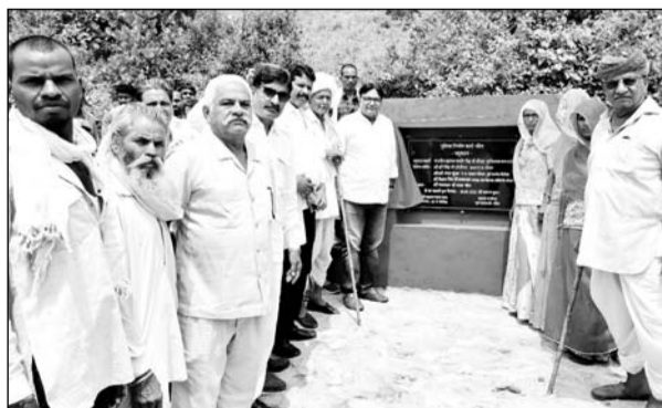
भीण्डर के चोल गांव में पूर्व विधायक भीण्डर ने पुलिया निर्माण का उद्घाटन किया।

दिव्यांगों पर स्नेह का ऐसा उल्लास बिखेरा कि जहां से भी बिंदोली गुजरती वहां खड़े लोगों ने फूल बरसाते हुए झुम उठा। लकदक रोशनी के साथ निकली इस बिंदोली में 51 जोड़े बर्गी, जीपों में सवार थे।