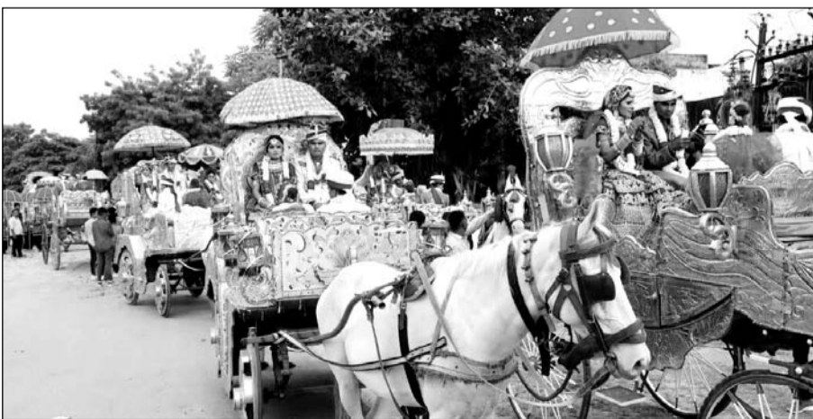
उदयपुर में दिव्यांग निर्धन जोड़ों की बिंदोली निकाली गई।