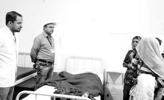
गजनेर सामुदायिक स्वास्थ्य केन्द्र में सीएमएचओ डॉ अबरार पंवार ने मरीजों से फीडबैक लिया।

डॉ. पंवार ने सामुदायिक स्वास्थ्य केन्द्र में मुख्यमंत्री चिरंजीवी स्वास्थ्य बीमा योजना से प्रत्येक परिवार को जोड़ने के लिए की गई कार्यवाही का निरीक्षण किया। पुष्कर अभियान से मिल रहे फायदों के मद्देनजर इसकी गुणवत्ता बनाये रखने पर जोर दिया। उन्होंने सीएचसी में दवाओं की उपलब्धता व एक्सपैर्यरी एवं नियर एक्सपैर्यरी दवाइयों को अलग से रखने के निर्देश दिए। सीएचसी निरीक्षण के दौरान वार्ड में भर्ती चिरंजीवी योजना में जुड़े हुए मरीजों से भी स्वास्थ्य सुविधाओं और सेवाओं की जानकारी ली। संस्थान प्रभारी डॉ शुभम चरण को मुख्यमंत्री चिरंजीवी स्वास्थ्य बीमा योजना में गैर पंजीकृत परिवारों को योजना से जोड़ने हेतु सभी कार्मिकों को माइक्रो प्लान बनाकर इस कार्य में शत-प्रतिशत