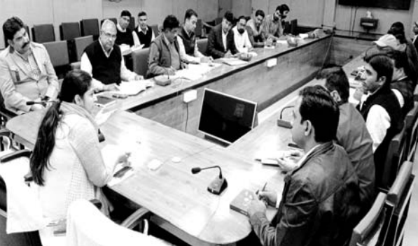
हनुमानगढ़ कलेक्टर रूक्मिणी रियार सियाग ने पर्यटन विकास समिति की बैठक को संबोधित किया।

कलेक्टर रूक्मिणी रियार की अध्यक्षता में मंगलवार को कलेक्टर सभागार में हुई जिला पर्यटन विकास