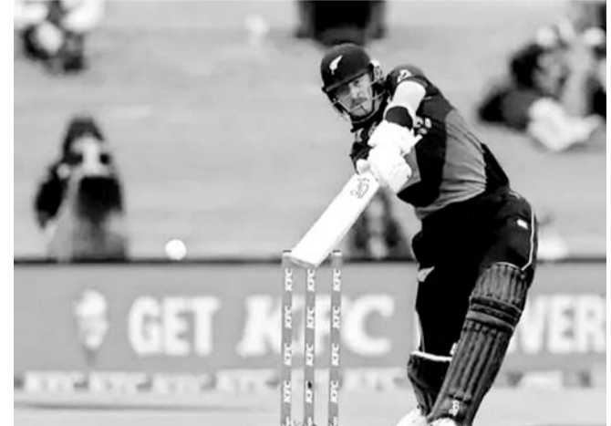
मैं अपने देश के लिए 367 मैच खेलकर भाग्यशाली महसूस करता हूं। मैं अपने सभी टीम-साथियों और कोचिंग स्टाफ को धन्यवाद देना चाहता हूं। विशेष रूप

नई दिल्ली, 8 जनवरी। न्यूजीलैंड के ओपनर बल्लेबाज मार्टिन गुप्टिल ने बुधवार को इंटरनेशनल क्रिकेट से संन्यास ले लिया। वह वर्ल्ड कप में सबसे बड़ा इंडिविजुअल स्कोर बनाने वाले बल्लेबाज हैं। गुप्टिल ने 2015 के वर्ल्ड कप में वेस्टइंडीज के खिलाफ नाबाद 237 रन की पारी खेली थी।