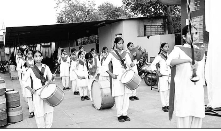
अखिल भारतीय विद्या भारती शिक्षा संस्थान के तत्वावधान में बुधवार को जयपुर में जवाहर नगर के सरस्वती बालिका विद्या मन्दिर में विज्ञान मेले का शुभारम्भ हुआ। इस अवसर पर बालिकाओं ने रंगारंग प्रस्तुति दी।