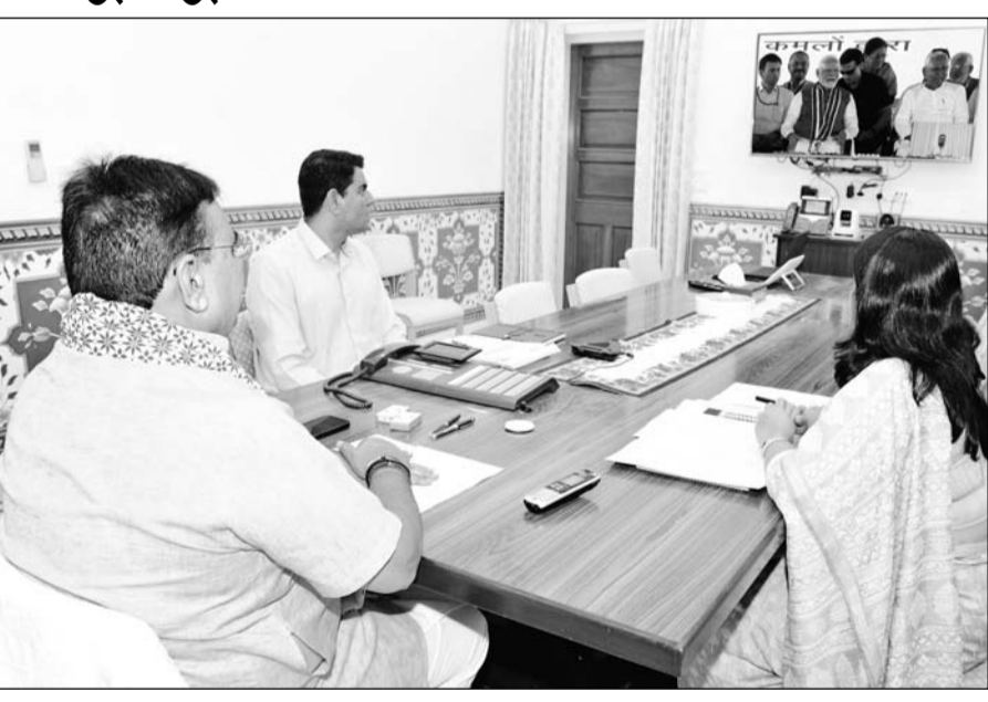
प्रधानमंत्री नरेन्द्र मोदी ने बुधवार को बिहार के दरभंगा से देश को 12 हजार करोड़ रुपए की सड़क, रेलवे, स्वास्थ्य सहित विभिन्न सेक्टर की 25 से अधिक परियोजनाओं की सौगात दी। मुख्यमंत्री भजनलाल शर्मा मुख्यमंत्री निवास से इस कार्यक्रम में वीडियो कॉन्फ्रेंस के माध्यम से जुड़े।

जयपुरा प्रधानमंत्री नरेन्द्र मोदी ने बुधवार को बिहार के दरभंगा से देश को 12 हजार करोड़ रुपए की सड़क, रेलवे, स्वास्थ्य सहित विभिन्न सेक्टर की 25 से अधिक परियोजनाओं की सौगात दी। कार्यक्रम में राजस्थान में भी जयपुर, बाड़मेर एवं फालना में प्रधानमंत्री