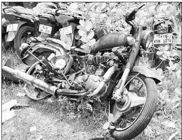
जयपुर में मोतीडूंगरी रोड पर गणेश मंदिर चौराहे पर हुए हादसे में क्षतिग्रस्त बाइक और कार।

पुलिस ने बताया यह हादसा सोमवार अलसुबह 3 बजकर 5 मिनट