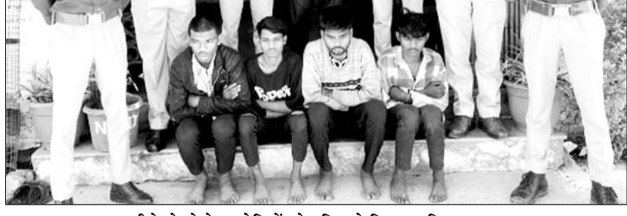
कार पर पथराव कर शीशे तोड़ने के आरोपियों को पुलिस ने गिरफ्तार किया।

डूंगरपुर, (निर्स)। कोतवाली थाना पुलिस ने चार बदमाशों को गिरफ्तार किया है। बदमाशों ने कार और ऑटो के बीच टक्कर के बाद पथराव कर दिया था, जिसमें कार के शीशे फूट गए थे। मामले में पुलिस आरोपियों से पूछताछ कर रही है।