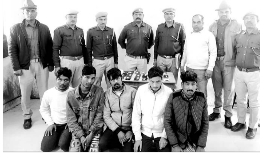
पुलिस ने मोबाइल चोरी के आरोपियों को पकड़ा।

अजमेर, (कास)। विश्व विख्यात सुफी संत हजरत ख्वाजा गरीब नवाज के सालाना उर्स में जायरीनों के मोबाइल चोरी करने वाली गैंग के पांच आरोपियों को दरगाह थाना पुलिस ने गिरफ्तार किया है। आरोपियों के कब्जे से 6.30 लाख कीमत के 21 मोबाइल बरामद किए हैं। आरोपी भीड़ का फायदा उठाकर वारदात को अंजाम देते हैं।