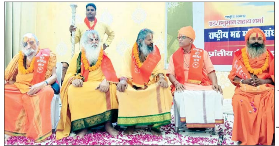
राष्ट्रीय मठ मंदिर संघ की ओर से जयपुर में आयोजित महाधिवेशन में संत-महंतों ने हिस्सा लिया।

जयपुर। राष्ट्रीय मठ मंदिर संघ द्वारा जयपुर में महाधिवेशन का आयोजन किया गया, जिसमें विभिन्न मठ-मंदिरों के महंत, पुजारी एवं संगठन के पदाधिकारियों ने भाग लेकर धार्मिक एवं सामाजिक विषयों पर विस्तार से विचार-विमर्श किया। कार्यक्रम में मुख्य अतिथि के रूप में विधायक गोपाल शर्मा उपस्थित रहे। महाधिवेशन का आयोजन संघ के राष्ट्रीय अध्यक्ष हनुमान सहाय शर्मा एवं