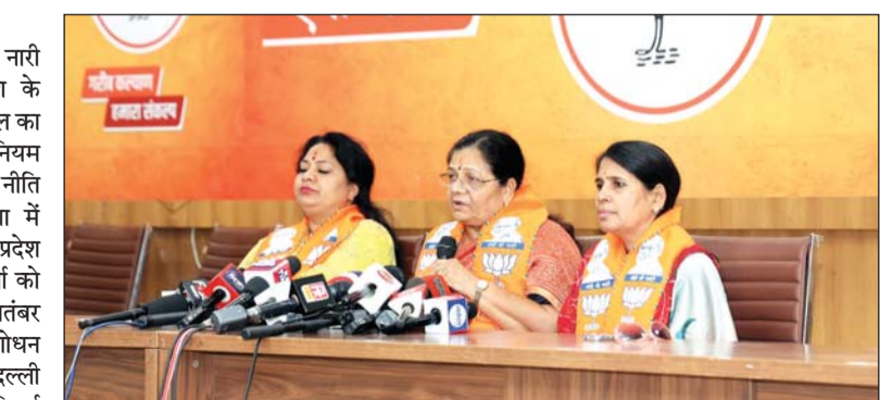
जयपुर शहर सांसद मंजू शर्मा ने रविवार को भाजपा प्रदेश कार्यालय में प्रेसवार्ता की।

जयपुर। जयपुर शहर सांसद मंजू शर्मा ने नारी शक्ति वंदन अधिनियम-2023 को देश के लोकतांत्रिक इतिहास में एक ऐतिहासिक मील का पत्थर बताया है। उन्होंने कहा कि यह अधिनियम महिलाओं को सशक्त बनाने के साथ उन्हें नीति निर्माण की मुख्यधारा में लाने की दिशा में महत्वपूर्ण भूमिका निभाएगा। भाजपा प्रदेश कार्यालय में रविवार को आयोजित प्रेसवार्ता को संबोधित करते हुए सांसद शर्मा ने कहा कि सितंबर 2023 में पारित यह संवैधानिक संशोधन लोकसभा, राज्य विधानसभाओं और दिल्ली विधानसभा में महिलाओं के लिए एक-तिहाई आरक्षण सुनिश्चित करता है। यह कदम महिलाओं के सशक्तिकरण के साथ-साथ देश के समग्र विकास को नई गति देगा।