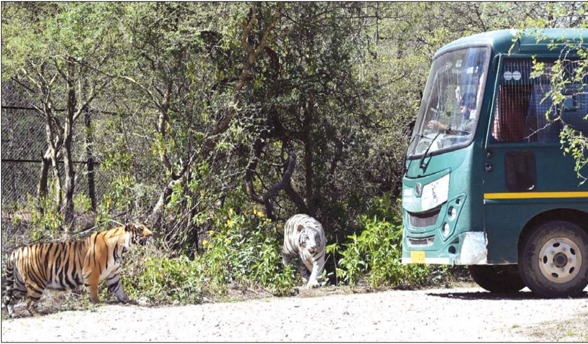
रविवार को नाहरगढ़ जैविक उद्यान में सफारी के दौरान सैलानियों ने टाईगर्स का नजदीक से अवलोकन किया।

नाहरगढ़ जैविक उद्यान में संचालित दो प्रमुख सफारियाँ - टाइगर सफारी और लायन सफारी - इन दिनों जयपुरवासियों और बाहर से आने वाले पर्यटकों के लिए बड़ी आकर्षण का केंद्र बनी हुई है। शहर के मध्य में प्राकृतिक हरियाली और