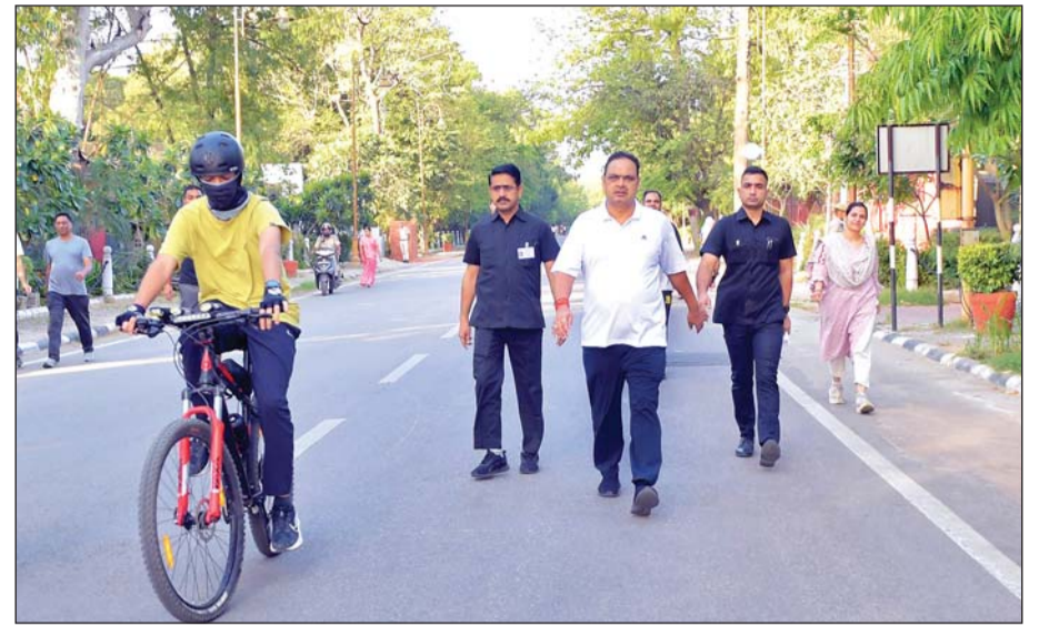
मुख्यमंत्री भजनलाल शर्मा ने रविवार सुबह मुख्यमंत्री निवास के बाहर लोक भवन रोड पर मॉर्निंग वॉक की।

योग एवं व्यायाम को बताया स्वस्थ जीवन का सूत्र