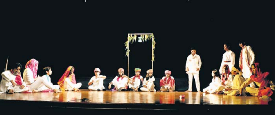
जवाहर कला केन्द्र में रविवार को रंगायन मंच पर प्रतिभागी बच्चों द्वारा तैयार 12 नाटकों का मंचन किया गया।

दिखाया। इस कार्यशाला में बच्चों ने न केवल अभिनय की बारीकियां सीखी बल्कि उनकी पर्सनालिटी में डेवलपमेंट भी हुआ। रविवार, 18 जून को रंगायन के मंच पर प्रतिभागी बच्चों द्वारा तैयार 12 नाटकों का मंचन हुआ। ये नाटक बच्चों और उनके प्रशिक्षकों को महाने भर की मेहनत की कहानी बयां कर गाय। रंगकर्म के मार्ग पर प्रशस्त इन बच्चों ने अपनी दुनिया से निकली कहानियों से विभिन्न मुद्दे उठाये। इनमें से 10 नाटकों का मंचन 19 और 20 जून को भी होगा।