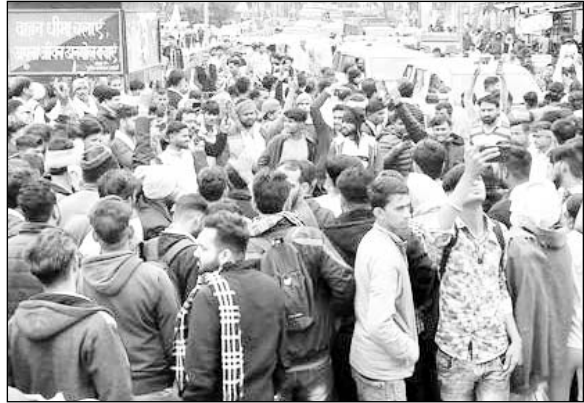
करौली कलेक्ट्रेट सफिकल पर पीड़ित परिवारजनों के साथ लोगों ने धरना देकर जाम लगाया।