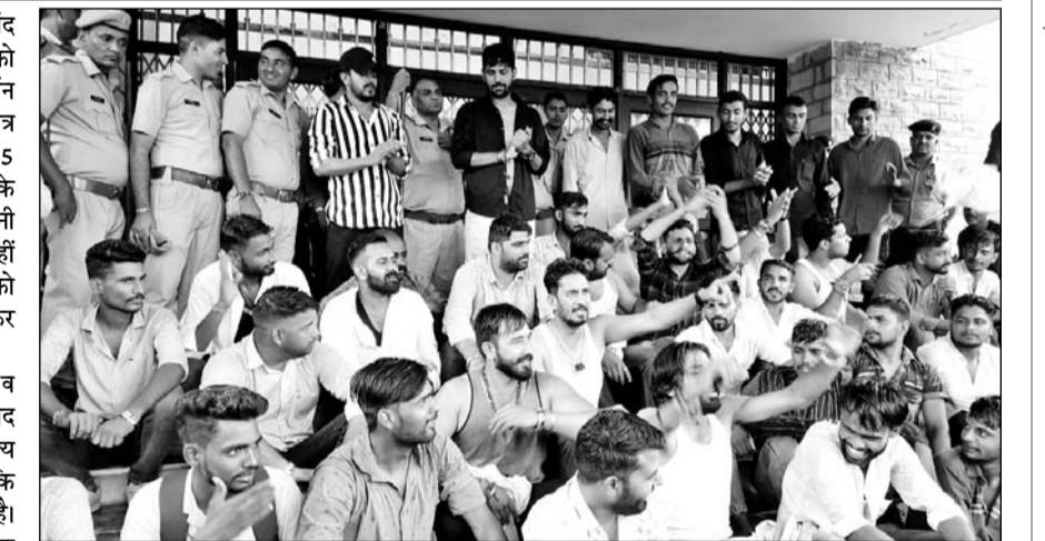
छात्र नेताओं ने पुलिस की मौजूदगी में अर्धनग्न प्रदर्शन किया।