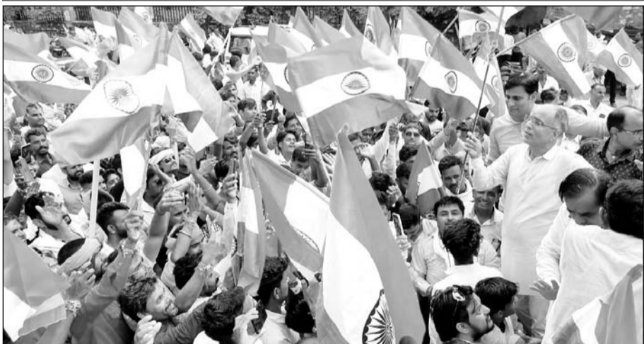
टोडारायसिंह में 1100 से अधिक दुपहिया वाहनों के साथ तिरंगा रैली निकाली गई।

201 फीट का तिरंगा रहा मुख्य आकर्षण का केन्द्र