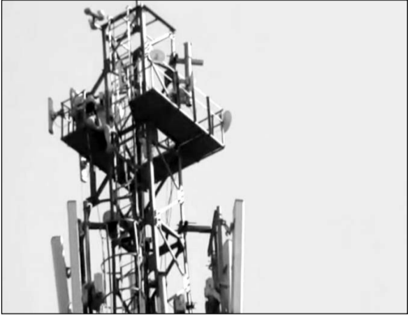
भतीजे की हत्या के आरोपियों की गिरफ्तारी की मांग को लेकर एक व्यक्ति टॉवर पर चढ़ गया।

भरतपुर, (निसं)। कोतवाली थाना क्षेत्र में मुखर्जी नगर में एक व्यक्ति मर्डर के आरोपियों की गिरफ्तारी की मांग को लेकर बीएसएनएल के टावर पर चढ़ गया। व्यक्ति की मांग है कि डींग के सदर थाना इलाके में पांच फरवरी को उसके परिवार के लोगों पर फायरिंग हुई थी, जिसमें उसके भतीजे की मौत हो गई थी। मृतक के परिजनों ने 17 लोगों के खिलाफ एफआईआर डींग जिले में दर्ज करवाई थी, जिसमें से दस की गिरफ्तारी हो गई है। बाकी आरोपियों की भी जल्द ही गिरफ्तारी की जाए इसके अलावा आरोपी पक्ष उन्हें आये दिन जान से मारने की धमकियां दे रहे हैं। जब इसके बारे में पुलिस से शिकायत की जाती है तो, पुलिस कोई कार्रवाई नहीं करती है।