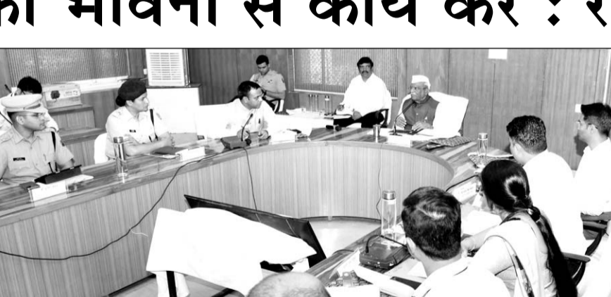
कोटा में राज्यपाल ने जिला स्तरीय अधिकारियों से संवाद कर निर्देश दिए।