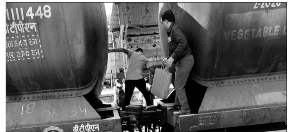
फुलेरा जंक्शन पर रेलयात्री जान जोखिम में डालकर रेलवे स्टेशन पहुंच रहे हैं।

परेशानियों का सामना करना पड़ेगा। प्रशासन द्वारा रेलवे स्टेशन के अंतिम छोर में बनाया गया ओवरब्रिज भी काफी ऊंचा होने के कारण बुजुर्गों को यहां से आने-जाने में काफी दिक्कतों का सामना करना पड़ता है। इसके चलते यहां एस्केलेटर या लिफ्ट लगे तो जरूर इनको राहत मिल सकती है लेकिन अभी वर्तमान में स्थिति काफी दयनीय है। जबकि फुलेरा से प्रतिदिन 15 हजार से अधिक दैनिक रेलयात्री अपनी रोजी रोटी कमाने के लिए जयपुर एवं अजमेर सहित अन्य स्थानों की पूरी नहीं तोड़ी गई है। कई बार तो ओवरब्रिज होकर जाते जाते इनकी ट्रेन भी छूट जाती है।