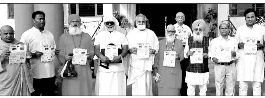
विक्र स्मार्ट स्टिकर का विमोचन करते अतिथि।

उदयपुर, (कासं)। भारतीय सर्व धर्म संसद के वरिष्ठ धर्म गुरुओं के सम्मान में मोहनलाल सुखाडिया विवि के प्रांगण में विक्र रोड सेफ्टी स्टिकर का विमोचन किया गया। यह स्टिकर सड़क सुरक्षा और पार्किंग की समस्याओं को सुलझाने के लिए एक महत्वपूर्ण समाधान के रूप में प्रस्तुत किया गया। विक्र स्मार्ट स्टिकर सड़क सुरक्षा के क्षेत्र में एक नवीनतम इनोवेशन है, जिसका उद्देश्य सड़क दुर्घटनाओं को स्थिति में त्वरित और प्रभावी सहायता प्रदान करना है। स्टिकर की प्रमुख विशेषताएँ निम्नलिखित हैं। विक्र स्मार्ट स्टिकर दुर्घटना की स्थिति में परिवारजनों