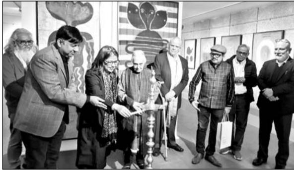
जयपुर के आईसीए और मीच क्राइडस की ओर से रविवार को दिल्ली के ओपन पाम कोर्ट गैलरी में प्रदर्शनी आयोजित हुई।

जयपुर। दुनियाभर से आए अनुभवी आर्ट क्यूरेटर्स, कलेक्टर और आर्टिस्ट्स ने भारत की सभ्यता और संस्कृति के संगम को कैनवास पर निहारना। मौका था दिल्ली के इंडिया हैबिटेट सेंटर के ओपन पाम कोर्ट गैलरी में जयपुर के आईसीए आर्ट गैलरी द्वारा आर्ट एजीबिशन का। आईसीए आर्ट गैलरी और द क्राइडस कलेक्शन ने इस आर्ट उत्सव में सम्वेगा आर्ट प्रदर्शनी का आयोजन किया जिसमें जयपुर के 11 सीनियर आर्टिस्ट्स के कलेक्शन को शोकेस किया जा रहा है।