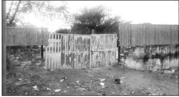
विद्याधर नगर सेक्टर-7 में विवादित भूखंड पर कोर्ट स्ट्रे होने के बावजूद भी बाउंड्रीवाल के सहारे-सहारे बांस की नई दीवार खड़ी कर ली गई।

जयपुर (कास)। जयपुर विकास प्राधिकरण ने 20 करोड़ रु. में 2200 वर्गमीटर जो भूखंड बिल्डर को बेचा, उसका कब्जा करीब 2 साल बाद भी नहीं संभलवा पाया। उधर भू-माफियाओं ने इस बेशकीमती सरकारी जमीन पर अवैध कब्जा कर कर लिया। इसके बावजूद जे.डी.ए. के जौन-2 के अधिकारी और प्रवर्तन शाखा इस भूखंड को खाली नहीं करवा पाये। बताया जा रहा है कि इस जमीन के पूर्व खातेदार परिवार के साथ किसी व्यक्ति ने वसोयत का हवाला देकर कोर्ट का स्ट्रे ले लिया, परंतु 2 साल से ज्यादा समय बीतने के बाद भी बिल्डर को कोई सुनवाई नहीं हो रही। पीड़ित तिरूपति बिल्ड होम ने जे.डी.ए. प्रशासन को कार्यशील पर खाल उठाते हुए अफसरों और भू-माफियाओं का गठजोड़ होने का आरोप लगाया।