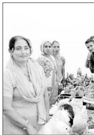
पंचायत राज मंत्री रमेश चंद मीणा ने अलवर के प्रताप ऑडिटीोरियम में पंचायत राज की ओर से आयोजित कार्यक्रम में भाग लिया।

अलवर, (निर्स)। पंचायत राज मंत्री रमेश चंद मीणा बुधवार को अलवर के प्रताप ऑडिटीोरियम में पंचायत राज की ओर से आयोजित कार्यक्रम में भाग लेंगे आए थे।