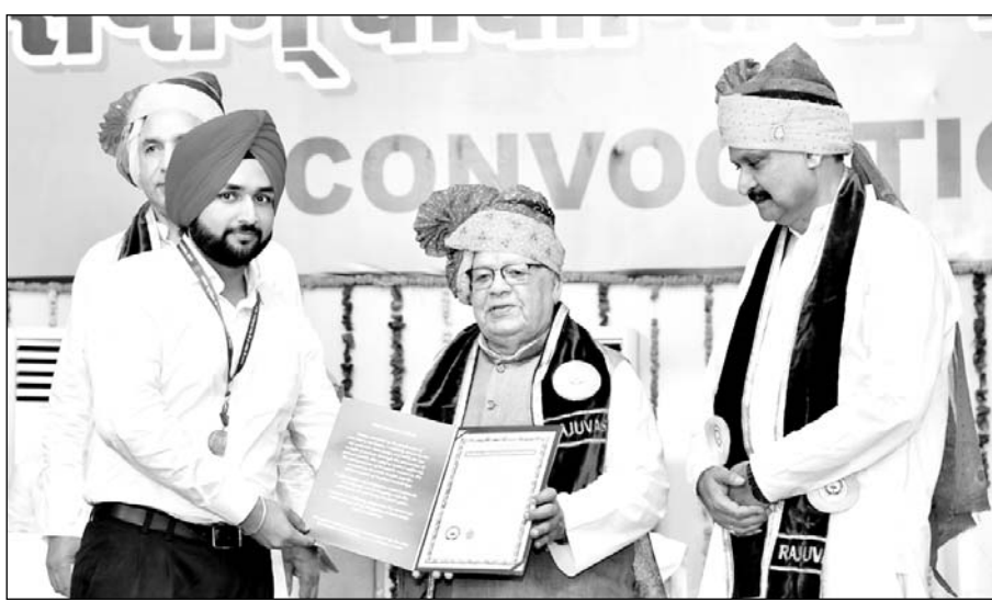
बीकानेर के वेटनरी विश्वविद्यालय के दीक्षांत समारोह में राज्यपाल कलराज मिश्र ने स्वर्ण पदक व उपाधियां प्रदान कीं।

राज्यपाल ने कहा कि बढ़ती जनसंख्या घटती कृषि जोत पानी तथा अन्य प्राकृतिक संसाधनों की कमी मनुष्य के लिए एक बड़ी चुनौती है। ऐसे में पशुधन और पशु उत्पाद ही पोषण सुरक्षा की दृष्टि से वरदान साबित हो सकते हैं। इसके लिए खाद्य और दूध उद्योगों में छोटे और मध्यम उद्यमों को बढ़ावा देने की आवश्यकता है। राज्यपाल मिश्र ने कहा कि राजुवास तीन संघटक पशु चिकित्सा विज्ञान महाविद्यालयों एक डेयरी एवं खाद्य प्रौद्योगिकी महाविद्यालय आठ सम्बद्ध महाविद्यालयों तथा 101 डिप्लोमा संस्थानों के माध्यम से प्रदेश में पशु चिकित्सा शिक्षा अनुसंधान एवं प्रसार के क्षेत्र में सराहनीय कार्य कर रहा है। ऐसे में विश्वविद्यालय प्रसार शिक्षण के