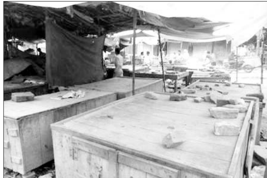
करौली में बन्द पड़ी माली समाज की फल सब्जी की दुकानें।

सैनी माली समाज के समाज के लोग, थोक सब्जी मंडी, फुटकर सब्जी की दुकानें व अन्य प्रतिष्ठानों के लोगों का कहना है कि जब तक दोषी पुलिसकर्मियों को बर्खास्त नहीं किया जाएगा और जेलों में बंद सभी समाज के लोगो को रिहा नहीं किया जाता तब तक यह प्रतिष्ठानों को बंद करने का एवं धरना प्रदर्शन का कार्य अनिश्चितकाल चलैगा सैनी, माली समाज पिछले लंबे समय से 12 प्रतिशत आरक्षण की मांग को लेकर राजस्थान में जगह-जगह धरना प्रदर्शन कर जिला कलेक्टर उप जिला कलेक्टर के माध्यम से ज्ञापन देकर मांग करता रहा है गत 15 सितंबर को जयपुर के विधाधर नगर स्टेडियम में सैनी, माली समाज की हल्ला बोल रैली आयोजित की गई इस दौरान सरकार की तरफ से कोई पक्ष वार्ता