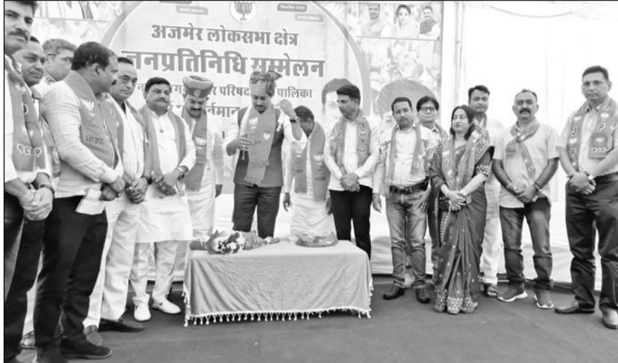
अजमेर में मंत्री राज्यवर्धन सिंह राठौड़ ने भाजपा पार्टी परिसर में पूर्व सैनिकों को संबोधित किया।

केबिनेट मंत्री राज्यवर्धन सिंह राठौड़ ने कहा कि मैं भी आप सभी में से एक हूँ। मैं भी सैनिक रहा हूँ। एक फौजी से दूसरे फौजी का कनेक्शन होता है। जब वह एक दूसरे से मिलता है तो आत्मीयता का अनुभव होता है। इस अवसर पर उन्होंने कहा कि प्रधानमंत्री सैनिकों का बड़ा सम्मान करते हैं वे जल, थल, आकाश की रक्षा करने वाले सैनिकों के पास जाते हैं उनके बातचीत करते हैं, ताकि उनका मनोबल बना रहे। सोशल मीडिया के माध्यम से फौजी अपने परिवार के बारे में जानकारी रखता है। उसे सीमा पर चिंता नहीं है क्योंकि मोदी सरकार में उनका परिवार सुरक्षित है। 2014 में खबरें लोक हो जाती थीं। जीवन कितना असंतुलित था। परन्तु मोदी सरकार के आते ही रक्षात्रत मजबूत हुआ कोई भी खबर इधर की उधर नहीं हो सकती है।