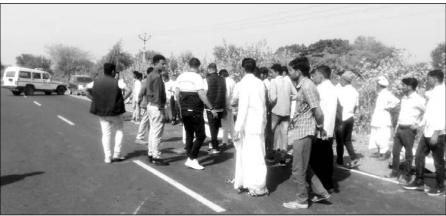
सायला के पास बावतरा गांव में रायलानाडा के पास स्टेट हाइवे पर एक ट्रैक्टर-ट्रॉली का संतुलन बिगड़ने से पलटने के बाद लोगों की भीड़ जमा हो गई।

सायला, (नि.सं.)। सायला पुलिस थाना क्षेत्र के बावतरा गांव में रायलानाडा के पास स्टेट हाइवे पर बुधवार को एक ट्रैक्टर-ट्रॉली का संतुलन बिगड़ने से पलट गई। हादसे में एक महिला की मौत हो गई। तीन जने गंभीर घायल हो गए तथा अन्य को मामूली चोटें आई हैं। प्राप्त जानकारी के अनुसार बावतरा गांव निवासी एक ही परिवार के करीब एक दर्जन सदस्य ट्रैक्टर-ट्रॉली में सवार होकर जीवाणा में रिश्तेदार के