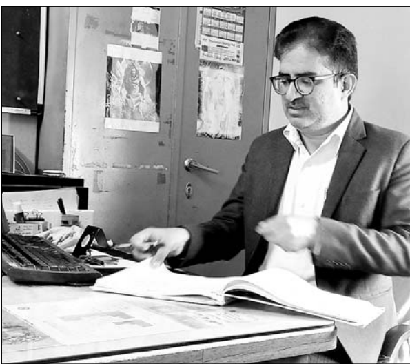
जालोर में विधिक सेवा प्राधिकरण के सचिव न्यायाधीश अहसान अहमद ने वात्सल्य चाइल्ड केयर होम का निरीक्षण किया।

जालोर, (कासं)। जिला विधिक सेवा प्राधिकरण जालोर के अध्यक्ष एवं जिला न्यायाधीश हारून के निर्देशन में जिला विधिक सेवा प्राधिकरण के सचिव अरुण जिला एवं सेशन न्यायाधीश अहसान अहमद में बुधवार को वात्सल्य चाइल्ड केयर होम जालोर का निरीक्षण कर व्यवस्थाओं का जायजा लिया। इस दौरान उन्होंने उपस्थित बालकों से वार्तालाप कर यहां मिलने वाली सुविधाओं के बारे में जानकारी ली, उन्होंने दोपहर में दिए गए भोजन के बारे में भी बालकों से जानकारी ली और भोजन की गुणवत्ता के बारे में पूछा। सचिव ने रसोईघर, मेडिकल किचन, बालकों के चयन कक्ष आदि का निरीक्षण कर उपस्थित कर्मचारियों को आवश्यक दिशा निर्देश दिए। उन्होंने कर्मचारियों को कहा कि बालकों को मिलने वाली सुविधाओं में किसी प्रकार की कमी नहीं रखें। उन्होंने समय-समय पर बच्चों के स्वास्थ्य की जांच करवाने एवं चिकित्सकों का निर्देशानुसार बालकों को प्रतिदिन