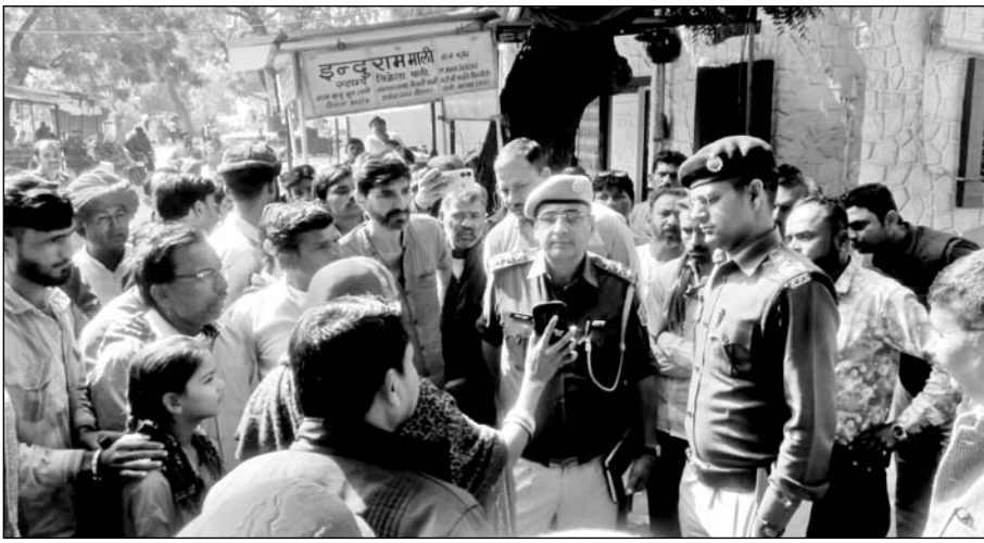
पाली में लोगों ने कलेक्टर पहुंचकर एस.पी. ऑफिस के बाहर प्रदर्शन किया।

पाली, (नि.सं.)। पाली में सैकड़ों लोग एसपी ऑफिस पहुंचे और उनके मोहल्ले में खुलेआम वेश्यावृत्ति होने की शिकायत की। उन्होंने कहा कि पहले भी कई बार शिकायतें दे चुके हैं, लेकिन पुलिस ने मामले में प्रभावी कार्रवाई नहीं की है। लोगों ने कहा कि गलत काम करने वाले लोग उनके परिवार को पुलिस केस में फंसाने की धमकी देते हैं। ऐसे में पुलिस को मामले में तत्काल कार्रवाई करनी चाहिए। मामला पाली शहर के सदर थाना क्षेत्र के मंडिया बाइपास के निकट स्थित किंग सिटी आवासीय योजना का है। यहां रहने वाले सैकड़ों लोग मंगलवार को कलेक्टर पहुंचे। पाली में एसपी ऑफिस के बाहर महिलाओं ने प्रदर्शन करते हुए आरोप लगाए कि शहर के पास एक गांव से असामाजिक तत्व गलत काम कर रहे हैं, जिससे उनकी कॉलोनी की बदनामी हो रही है। महिलाओं का आरोप है कि कुछ लोगों ने बस्ती में मकान बनाकर देह व्यापार का अड्डा बना दिया है। हमारी बस्ती में रहने वाले लोगों का जीना