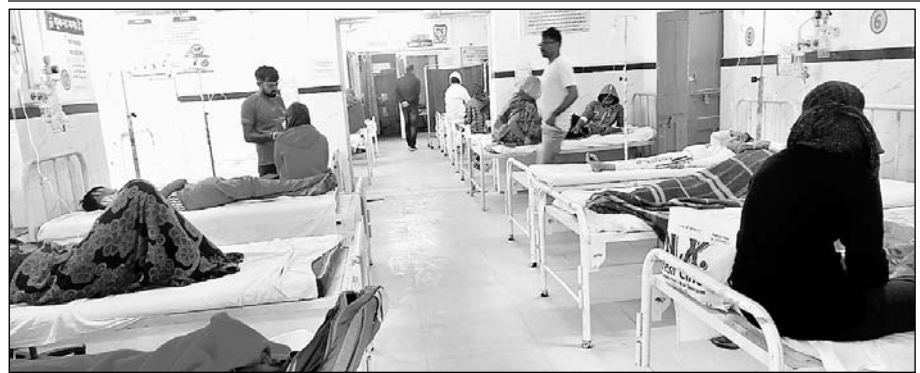
पावटा अस्पताल में भर्ती मरीज।

अस्पतालों में बुखार के मरीजों की भारी भीड़