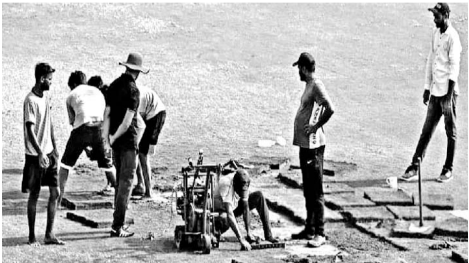
तैयारियों ने फिर खेल खराब कर दिया। पिच के आसपास इतना गीला था कि खेल हो पाना संभव नहीं था। वहीं इस तरह की स्थिति को देख कर अफगानिस्तान क्रिकेट बोर्ड के एक अधिकारी ने सोमवार को ही कहा था कि, यहां बहुत

नोएडा, 10 सितम्बर। अफगानिस्तान और न्यूजीलैंड टेस्ट मैच नहीं हो पा रहा है। दरअसल, इन दोनों के बीच भारत में खेला जाने वाला टेस्ट मैच दूसरे दिन भी शुरू नहीं हो सका। दोनों टीमों खेलने को तैयार है, मौसम भी साफ है लेकिन नोएडा स्टेडियम की खराब तैयारी ने पूरा मैच खराब कर दिया है। टेस्ट क्रिकेट के इतिहास में इससे खराब स्थिति शायद ही कभी देखने को मिली होगी। दो दिन से बारिश नहीं हुई हो और इसके बावजूद मैदान गीला होने के चलते खेल नहीं हो पा रहा है। अफगानिस्तान और न्यूजीलैंड के बीच 9 सितंबर से टेस्ट मैच प्रस्तावित है। ये मैच ग्रेटर नोएडा के शाहीद विजय सिंह पथक स्पोर्ट्स कॉम्प्लेक्स में होना है। दोनों टीमों इससे लिए काफी पहले ही नोएडा आ चुकी है। लेकिन खेल नहीं हो पा रहा है। दरअसल, मैच शुरू होने के एक दिन पहले यहाँ बारिश हुई, रात में भी बूंदबंदी होती रही। लेकिन सोमवार को मैच शुरू होना था, उस दिन बिलकुल भी बारिश नहीं हुई। कुछ समय बाद लज्जर छाप रहे और कुछ समय धूप खिली, लेकिन स्टेडियम की गीली आउटफील्ड और घंटियाँ जल निकासी के चलते पहले दिन का खेल एक भी गेंद फेंके बिना रह करना पड़ा। इससे भी ज्यादा शर्मनाक स्थिति तो दूसरे दिन देखने को मिली। जब मंगलवार को सुबह से ही धूप खिली और मौसम खेलने के लिए एकदम आइडिल था। लेकिन मैदान की