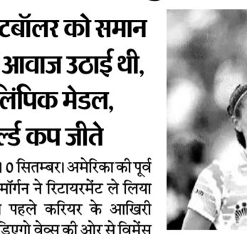
की मॉर्गन ने 16 साल लंबे इंटरनेशनल करियर में 2 ओलंपिक मेडल और 2 बार फीफा वर्ल्ड कप जीते। मॉर्गन ने अमेरिका की नेशनल टीम के लिए 224 मैच खेले। वे 9वीं सबसे ज्यादा

अमेरिका, 10 सितम्बर। अमेरिका की पूर्व कप्तान एलेक्स मॉर्गन ने रिटायरमेंट ले लिया है। वे एक दिन पहले करियर के आखिरी मुकाबले में सैन डिएगो वेक्स की ओर से विमेंस सॉकर लीग में उतरीं, हालांकि उनकी टीम उत्तरी कैरोलिना के खिलाफ 1-4 से हार गई। मॉर्गन के लिए यह मॉर्गन का 63वां मैच था। उन्होंने इस लीग में 150वां मुकाबला खेला। 35 साल