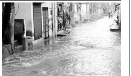
श्रीमाधोपुर में बारिश से गलियां लबालब हो गईं।