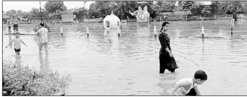
खेतड़ी में मूसलाधार बरसात से सड़कें पानी से लबालब हो गईं।