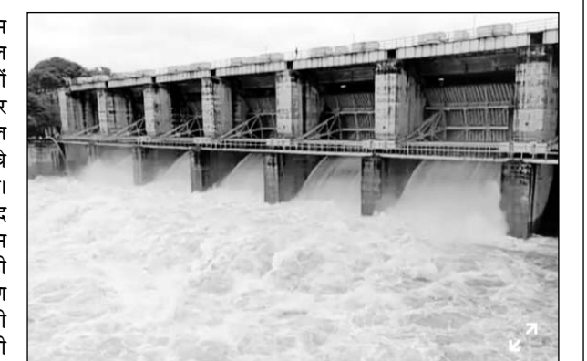
पांचना बांध के पांच गेट खोलकर पानी की निकासी की जा रही है।

इसी प्रकार वार्ड नंबर 44 में डांगरिया तालाब के ओवरफ्लो होने के चलते उसकी पाल तोड़कर पानी की निकासी की गई एवं माथुर स्टेडियम कि बाउंड्री, पावर हाउस की चारदीवारी ढह गई। करौली-मंडरायल मार्ग स्थित कई कॉलोनी में जलभराव से लोगों में आक्रोश है। आक्रोशित क्षेत्रवासियों ने