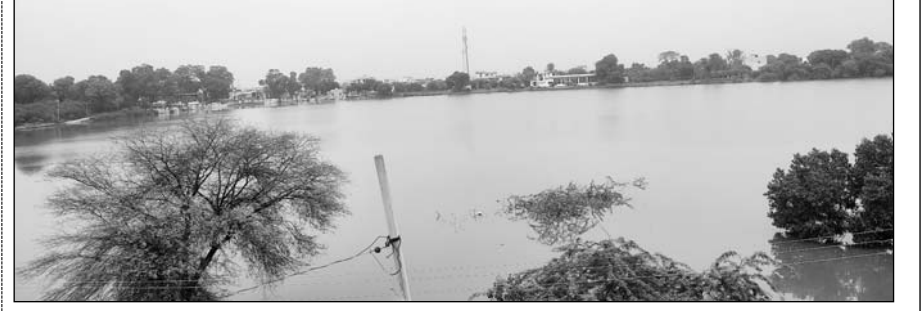
चाकसू कस्बे के बीचों-बीच स्थित मनहोरा तालाब ओवरफ्लो हो गया।

चाकसू, (निर्स)। मौसम विभाग की चेतावनी के मुताबिक क्षेत्र में तीन दिनों से लगातार बारिश हो रही है। आसमान से बरस रहे पानी से विधानसभा क्षेत्र के अधिकांशतः तालाब ओवरफ्लो हो गए हैं। बारिश से नगर पालिका क्षेत्र के निचले इलाकों और कच्चे-पक्के रास्तों में पानी भर गया है। बहुत से आम रास्ते तो कीचड़ में पड़े हैं जिससे लोगों का आवागमन दुश्वार हो गया है। कस्बे के मध्य में स्थित मनहोरा तालाब ओवरफ्लो हो गया है। मनोहर तालाब के पानी निकासी का प्रशासन