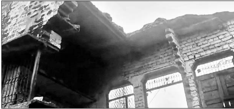
जुरहरा थाना क्षेत्र के गांव गांवड़ी में तेज बारिश से मकान गिर गया।

कामां, (निर्स)। जुरहरा थाना क्षेत्र के गांव गांवड़ी में तेज बारिश होने के कारण भरभराकर मकान गिर गया, जिसमें एक महिला और बच्ची की दबने से मौत हो गई तो वहीं एक व्यक्ति का पैर भी टूट गया और एक बच्ची की गंभीर हालत बताई जा रही है, जिसको अस्पताल में भर्ती कराया गया है।