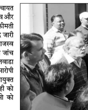
आरोपितों की गिरफ्तारी की मांग को लेकर सरपंच संघ ने बीडीओ को ज्ञापन दिया।

मांडलगढ, (निर्स)। मांडलगढ पंचायत समिति की ग्राम पंचायत काछोला में सरपंच और ग्राम विकास अधिकारी ने सरकारी बेशकीमती भूमि में 50 से अधिक पट्टे नियम विरुद्ध जारी किए। जिससे पंचायत को करोड़ों के राजस्व की चपत लगी। इस मामले में विभागीय जांच में सरपंच और बीडीओ को दोषी मान भीलवाड़ा जिला परिषद सीईओ ने दो माह पूर्व दोनों आरोपी के खिलाफ कार्रवाई के लिए सम्भागीय आयुक्त को पत्र प्रेषित किया लेकिन अब कार्रवाई को ठंडे बस्ते में डाल सरपंच और बीडीओ को बचाया जा रहा है।