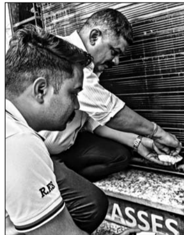
को जाएगी। उनके क्षेत्र में मंगलवार को 15 से अधिक संस्थानों को सील किया गया। नगर निगम प्रशासन का कहना है कि नागरिकों की सुरक्षा को ध्यान में रखते हुए बिना अग्नि सुरक्षा मानकों का पालन किए संचालित किसी भी संस्थान को बख्शा नहीं जाएगा।

अधिकारी (सीएफओ-1) गौतम ने बताया कि शहरभर में 1250 से अधिक भवन स्वामियों को बिना फायर एनओसी के व्यवसाय संचालन को लेकर नोटिस जारी किए गए हैं। उन्होंने कहा कि आगामी समय में नियमों की अवहेलना करने वाले सभी संस्थानों के खिलाफ कठोर कार्रवाई