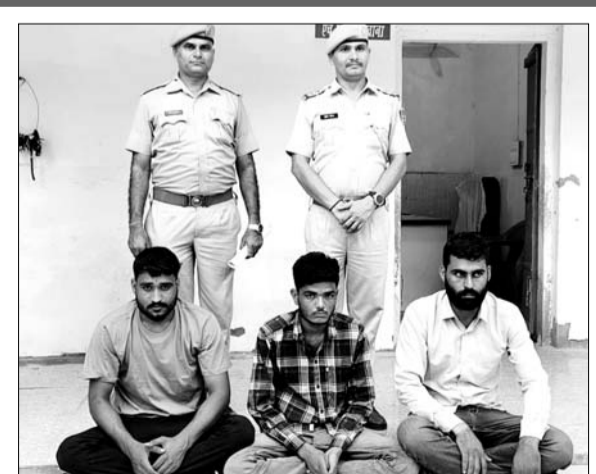
पुलिस ने हनीट्रेप मामले में तीन आरोपियों को गिरफ्तार किया।