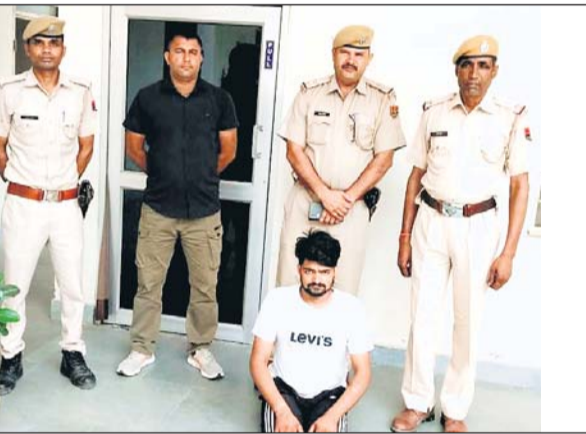
आरोपी के विरूद्ध विभिन्न अपराधों के 11 प्रकरण दर्ज हैं।