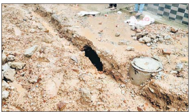
बारिश ने सीवरेज लाईन में बरती जा रही लापरवाही की पोल खोली