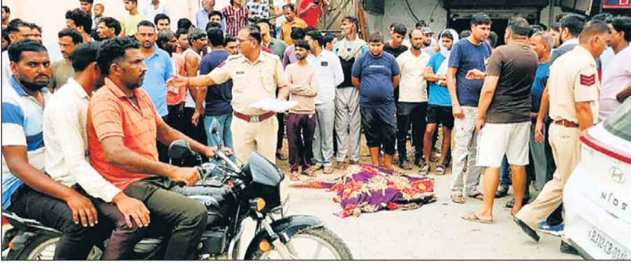
ओवरलोड व तेज रफ्तार वाहनों पर कार्रवाई और स्पीड ब्रेकर लगवाने का आश्वासन पर ग्रामीणों ने प्रदर्शन को समाप्त किया।