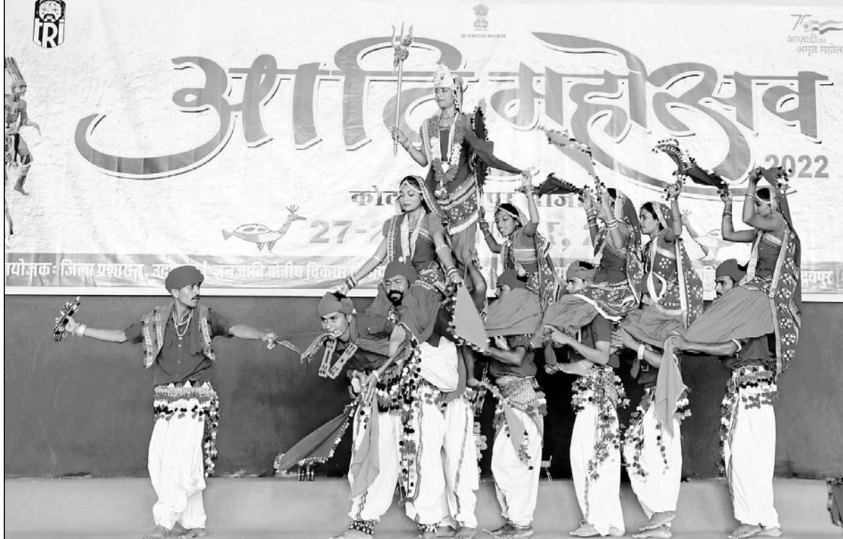
“आदि महोत्सव” के पहले दिन भारत के विभिन्न क्षेत्रों से आए लोक कलाकारों ने नृत्य की सामूहिक प्रस्तुती दी।