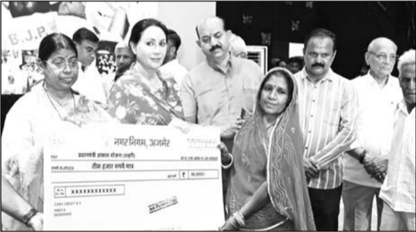
जिला स्तरीय कार्यक्रम में उप मुख्यमंत्री दिया कुमारी ने विभिन्न योजनाओं के लाभार्थियों को लाभान्वित किया।

अजमेर, (कासं)। राजस्थान दिवस साप्ताहिक महोत्सव के अंतर्गत गुरुवार को अंत्योदय कल्याण समारोह का आयोजन किया गया। मुख्यमंत्री भजनलाल शर्मा ने भरतपुर में आयोजित राज्य स्तरीय कार्यक्रम से संबोधित किया। वीसी के माध्यम से सीधा प्रसारण डॉ. भीमराव अंबेडकर मेडिकल कॉलेज सभागार में किया गया। उप मुख्यमंत्री दिया कुमारी ने जिला स्तरीय कार्यक्रम को संबोधित किया और विभिन्न योजनाओं के लाभार्थियों को भी लाभान्वित किया गया।