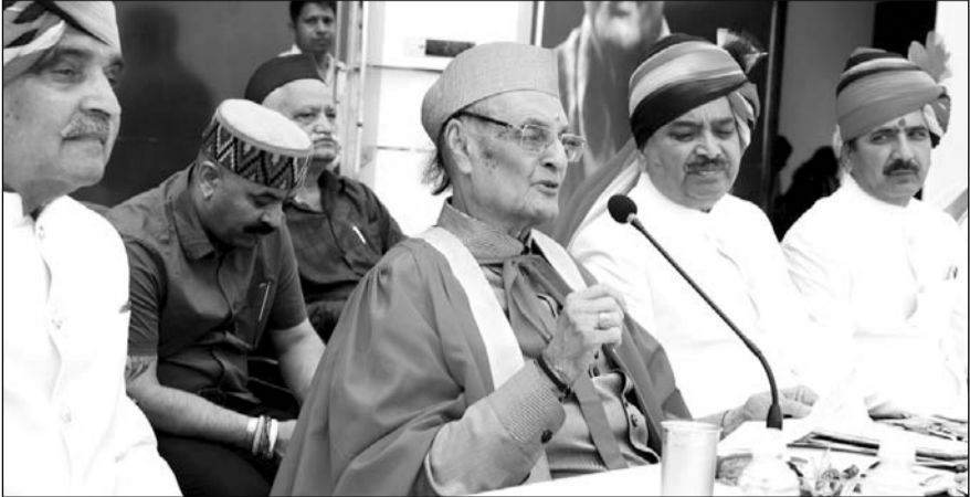
दीक्षांत समारोह को पूर्व केंद्रीय मंत्री व राज्यसभा सदस्य डॉ. कर्णसिंह ने संबोधित किया।

उदयपुर, (कासं)। उच्च शिक्षा में गुणवत्ता और शोध को प्रोत्साहित करने के लिए समर्पित उदयपुर के भूपाल नोबल्स विश्वविद्यालय के प्रथम दीक्षांत समारोह का आयोजन गुरुवार को भूपाल नोबल्स संस्थान के महाराणा प्रताप खेल मैदान पर सम्पन्न हुआ, जिसमें देशभर से प्रतिष्ठित अतिथियों की उपस्थिति रही। दीक्षांत समारोह बेटियों के नाम रहा। 147 में से 131 स्वर्ण पदक बेटियों को मिले तो सबसे चहरे खिल उठे। समारोह में 224 को पीएच.डी की उपाधि प्रदान की गई जिसमें से 154 बेटियों के नाम रही। इसमें भी 68.75 प्रतिशत अर्थात 154 पीएचडी सिर्फ बेटियों ने प्राप्त कर पचम फहरा दिया।