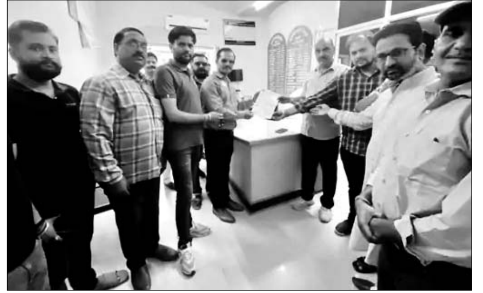
श्री राजपूत करणी सेना गंगापुर सिटी व राजपूत समाज ने जिला कलेक्टर के पीए को ज्ञापन दिया।

श्री राजपूत करणी सेना गंगापुर सिटी व राजपूत समाज ने जिला कलेक्टर कार्यालय में ज्ञापन दिया