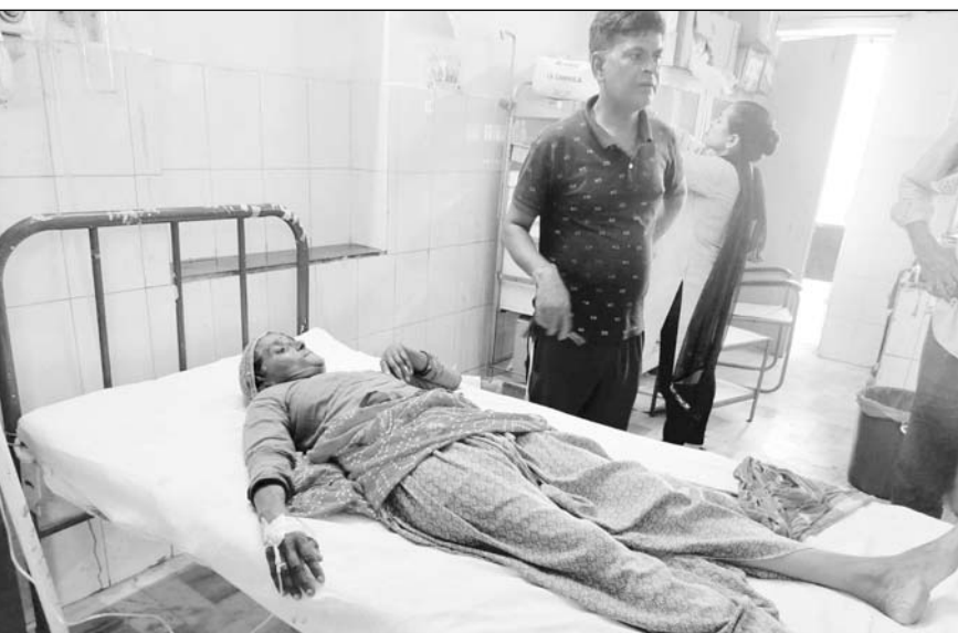
महिला को प्राथमिक उपचार के बाद जयपुर एसएमएस अस्पताल रेफर किया।