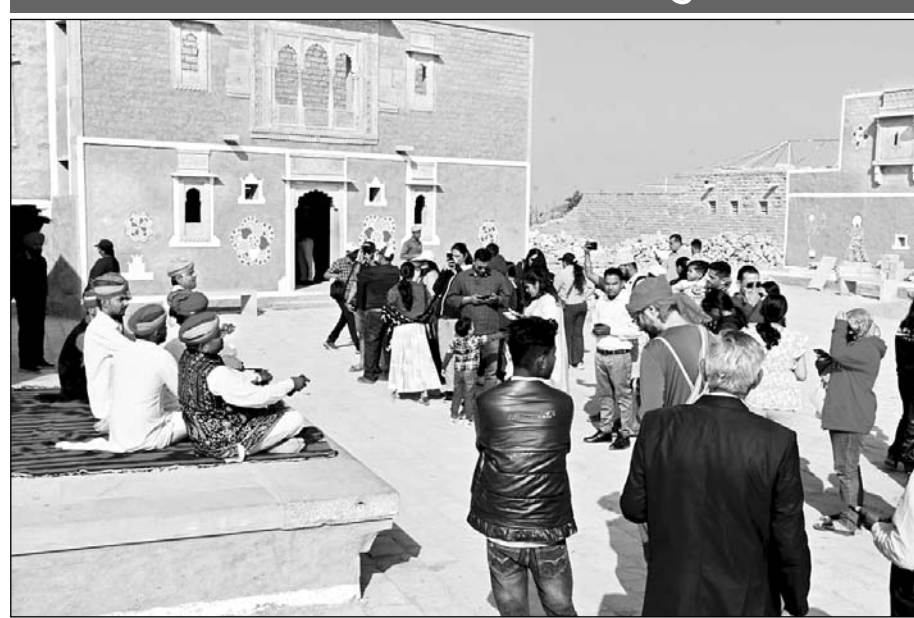
देशी-विदेशी सैलानियों ने स्थानीय मांडणाओं को बारिकी से देखा एवं अपने कैमरों में कैद किया।

मांडणा आर्ट प्रदर्शनी का पर्यटकों ने लुत्फ उठाया