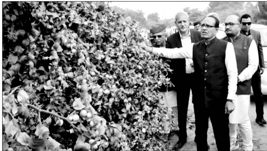
केन्द्रीय कृषि एवं किसान कल्याण मंत्री शिवराज सिंह चौहान ने काजरी का दौरा किया।

इस दौरान उन्होंने कहा कि प्रधानमंत्री नरेन्द्र मोदी का संकल्प किसानों की आय को बढ़ाना है। खेती से किसान को अच्छी आय हो और देश में अनाज, फल आदि के भण्डार भरे रहे, इसके लिए आईसीएआर काम कर रही है। उन्होंने कहा कि किसानों को खेती से मुनाफा बढ़ाने के लिए उन्हें जल्दी पकने वाली, कम समय, कम पानी की आवश्यकता वाली, लागत कम और मुनाफा अधिक हो ऐसी किस्में उपलब्ध करवायी जा रही हैं, ताकि किसान की आय बढ़े। कृषि मंत्री ने कहा कि खेती में लाभ अर्जित के लिए कृषि में विविधिकरण होना आवश्यक है। यज्ञे खुशी है कि काजरी संस्थान में जो समन्वित कृषि कैफेटेरिया एवं विभिन्न कृषि प्रणालियों