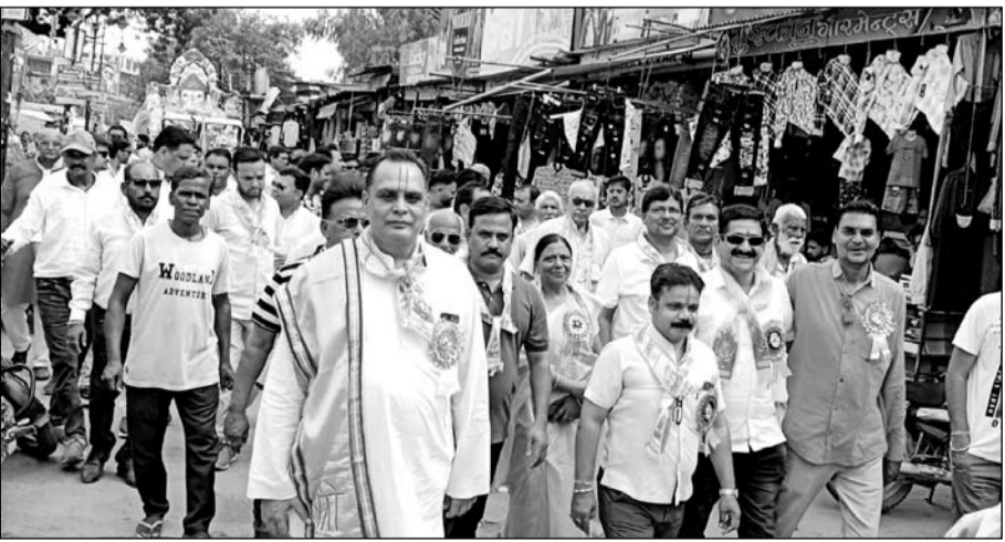
जिलेभर में अनंत चतुर्दशी महोत्सव बड़ी धूमधाम से मनाया गया।

बूंदी (निर्स)। जिले भर में अनंत चतुर्दशी महोत्सव बड़ी धूमधाम से मनाया गया। गणपति बप्पा मोरिया अगले बरस तू जल्दी आ के उद्घोषों के बीच भजनों की धुनो पर नाचते गाते श्रद्धालुओं ने गणपति बप्पा की पूजा अर्चना कर विदा किया। देररात तक शहर में जैतसागर, नवल सागर, बोहरा कुंड सहित मांगली नदी पर एक से 6 फीट तक की लगभग 2500 से ज्यादा छोटी बड़ी प्रतिमाओं का जलाशयों में विसर्जन किया जाता रहा। इससे पूर्व पूरे जोश के साथ गणेश प्रतिमाओं की पूजा अर्चना कर लोगों ने भगवान समक्ष अपनी अपनी प्रार्थनाएं भी की। अनन्त चतुर्दशी के अवसर पर शहर के अलग अलग हिस्सों से गणेश प्रतिमाओं को शोभायात्राएं निकाली गईं। इस दौरान श्रद्धालु दिनभर गणेश प्रतिमाओं को जल्यों के रूप में लेकर विसर्जन स्थल तक लाते रहे।