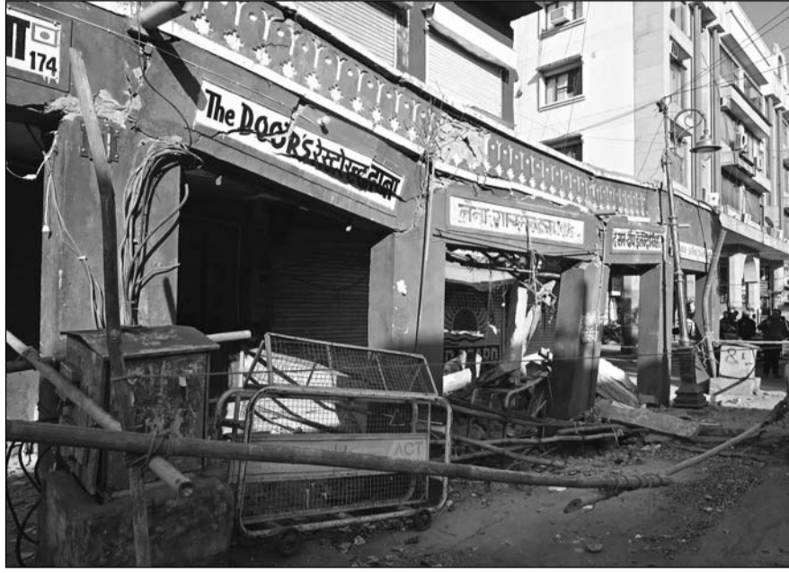
अजमेरी गेट स्थित नेहरू बाजार में शनिवार देर रात चार दुकानों के बाहर बरामदे की छत धराशायी हो गई। वहीं अन्य दुकानों का बाहरी हिस्सा भी सड़क की ओर झुका हुआ है।