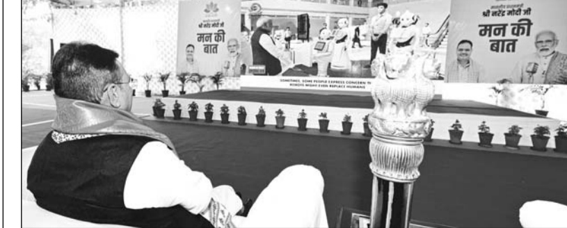
मुख्यमंत्री भजनलाल शर्मा ने रविवार को निज निवास पर आमजन के साथ प्रधानमंत्री नरेंद्र मोदी की ‘मन की बात’ कार्यक्रम की 129वीं कड़ी को सुना।

जयपुर (कास)। प्रधानमंत्री नरेंद्र मोदी ने रविवार को ‘मन की बात’ कार्यक्रम की 129वीं कड़ी में देशवासियों को संबोधित किया। वर्ष 2025 में इस कार्यक्रम की यह अंतिम कड़ी थी। प्रधानमंत्री ने अपने संबोधन में वर्ष 2025 में देश को विभिन्न क्षेत्रों में मिली उपलब्धियों और सफलताओं का जिक्र करते हुए उम्मीद जताई कि वर्ष 2026 विकसित भारत के संकल्प की सिद्धि में महत्वपूर्ण पड़ावा साबित होगा। मुख्यमंत्री भजनलाल शर्मा ने मुख्यमंत्री निवास पर आमजन के साथ मन की बात कार्यक्रम को सुना। प्रधानमंत्री ने अपने संबोधन में कहा कि देश ने वर्ष 2025 में अंतरिक्ष, विज्ञान, तकनीक, खेल, पर्यावरण सहित विभिन्न क्षेत्रों में महत्वपूर्ण उपलब्धियां हासिल कीं। उन्होंने कहा कि प्रयागराज में महाकुंभ