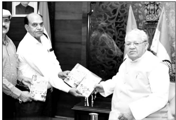
पुस्तकों का विमोचन करते राज्यपाल कलराज मिश्र।