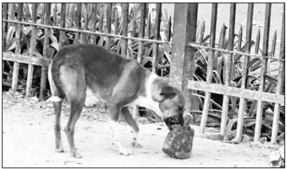
विद्याधर नगर में जेडीए प्रशासन द्वारा तैयार पर्यटन स्थल किशनबाग के सामने आवारा श्वान आये दिन मांस के टुकड़े लेकर घूमते रहते हैं, जो कि यहां पर्यटकों पर भी हमला करते हैं। फोटो-राष्ट्रदूत

जयपुर (कासं)। राजधानी जयपुर के पर्यटन स्थलों व आवासीय कॉलोनिजों में आवारा श्वानों का आतंक छाया हुआ है। शहर में आये दिन डॉग बाइट की घटनाएँ सामने आने के बावजूद भी ग्रेटर व हैरिटेज निगम के अधिकारी मूकदर्शक बने बैठे हैं। बीते 10 वर्ष में जयपुर नगर निगम ने श्वानों के बधियाकरण के लिए एंटी बर्थ प्रोग्राम (एबीसी) चलाने के नाम पर करोड़ों रुपये खर्च किये, लेकिन हालात आज भी भयावह हैं।